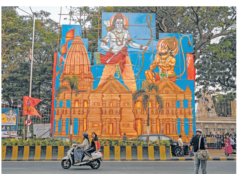
Ayodhya is expected to see huge footfalls ahead of the Ram temple inauguration.

drive on-ground brand activations. Packaged foods maker Parle Products said the days leading up to the 22 January