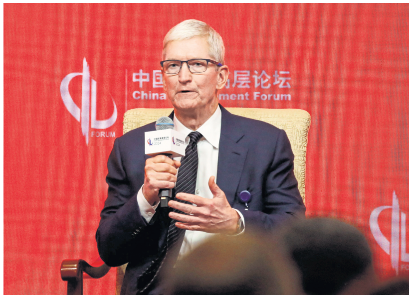
Apple chief executive Tim Cook said the March quarter saw the company register yet another quarterly revenue record in India.

Apple's India revenue is expected to rise 20% in FY25, putting it on track to become the iPhone-maker's third-largest market after China and the US within the next two to three years, analysts said, following reports of record revenues from India for the March quarter. Earlier on Friday, Apple's CEO, Tim Cook, said the March quarter saw the company register yet another quarterly revenue record in India—making this the eighth straight quarter, or two full years, of sustained growth for the brand in India. "We did grow by strong double digit, and were very, very pleased about it. I see India as an incredibly exciting market, and it's a major focus for us. In terms of the operational or the supply-chain side, we are producing there—from a pragmatic point of view, you need to produce there to be competitive," he said.