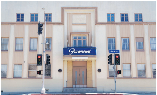
The joint bid comes as Paramount had been in exclusive merger talks with Skydance Media

Jessica Toonkel & Miriam Gottfried feedback@livemint.com